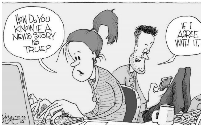
Dibuho ni Signe Wilkinson mula sa The Philadelphia Inquirer

Gawas sa atong mga emosyon, mas dali ug mas sayon pud nato dawaton ang mga impormasyon kung nagsubay sila daan sa atong mga gipangtuohan na. Mao kini ang ginatawag nga 'confirmation bias'. Ang peligro niini kay kung atong huna-hunaon nga sako ang usa ka butang tungod lang kay tan-aw nato nga dapat sako kini. Tinuod kini hilabi na sa misleading content – impormasyong dunay gamayng kamatuoran pero ang uban buhat-buhat nalang. Kung ang online post kay 'may pagka-tinuod' ug kumbinsido na dayon ka sa katunga pa lang niini, basin og imo nalang ibaliwala nga ang post kay 'may pagka-bakak' sab, o sa pinakaminos, dili kompleto.